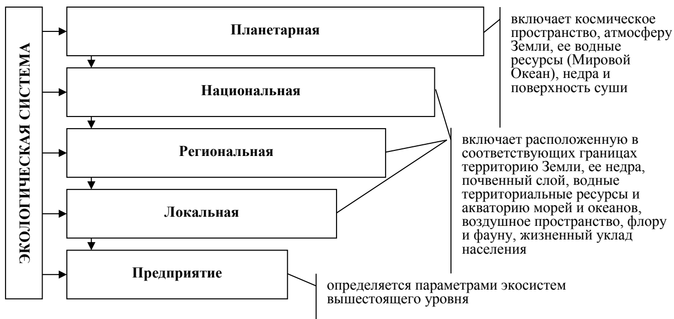
Рисунок 2 – Иерархическая структура планетарной экологической системы

проблем, являясь как источниками экологических угроз посредством чрезмерной эксплуатации сырьевых природных ресурсов и вредоносных выбросов во внешнюю среду, так и носителями экологических рисков, обусловленных возможностью подрыва естественной воспроизводственной способности природных ресурсов, снижением их качества (экологической безопасности) в результате загрязнения окружающей среды, ужесточением экологического законодательства и т.д. Данное обстоятельство позволяет рассматривать предприятие и как самостоятельный субъект взаимоотношений с окружающей природной средой, и как первичный базовый элемент глобальной (планетарной) экологической системы (рис. 2), в рамках которого реализуется экологическая функция – экологическая деятельность по обеспечению устойчивого состояния и устойчивого развития человечества (общества) и среды его обитания исходя из масштабов и специфики производственной деятельности.